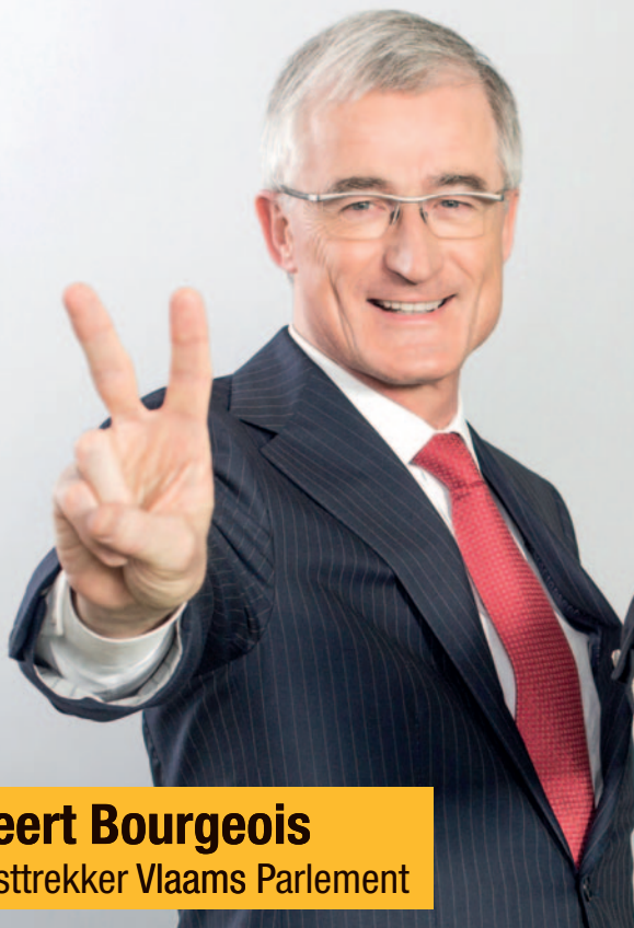
Geert Bourgeois Lijsttrekker Vlaams Parlement