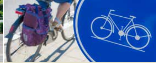
Fietsveiligheid, een gedeelde verantwoordelijkheid (p. 3)