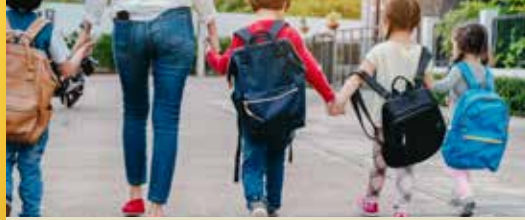
N-VA wil veiligere schoolomgevingen (p. 2)