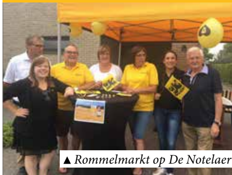
▲ Rommelmarkt op De Notelaer